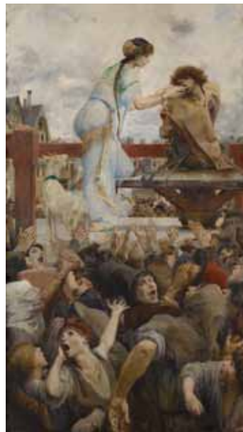
ABOVE Une larme pour une goutte d'eau, Luc-Olivier Merson, 1903

Victor Hugo was thirty years old when he moved into the 2nd floor of the Hôtel de Rohan-Guéméné with his wife Adèle Foucher and their four children, Léopoldine, Charles, François-Victor and Adèle. By this time he had already written the play "Bataille d'Hernani" and enjoyed widespread success with his novel Le Bossu de Notre-dame ( The Hunchback of Notre-Dame ).