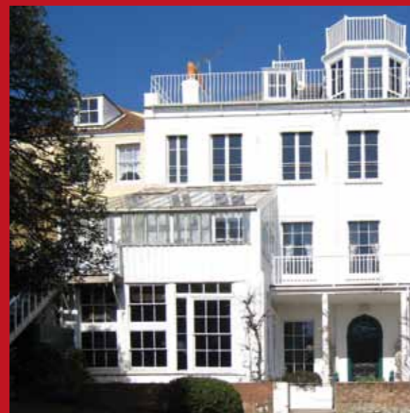
Hauteville House's front garden

Pago en libras esterlinas o mediante tarjeta bancaria