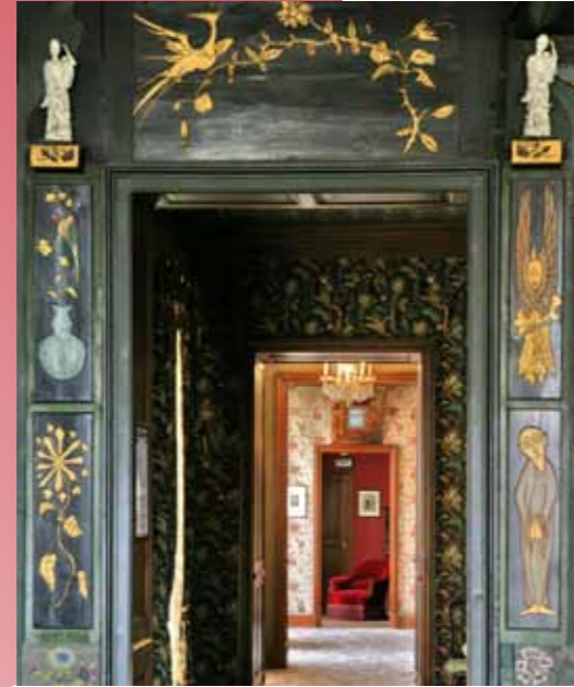
À DROITE Salon chinois