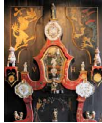
VISITEZ GRATUITEMENT LES COLLECTIONS PERMANENTES