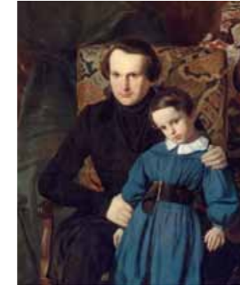
CI-DESSUS Portrait de Victor Hugo et de son fils François-Victor, Auguste de Chatillon, 1836

Avec le salon chinois et la salle à manger – et bien sûr Hauteville House – le musée est le seul à présenter cet aspect méconnu du génie artistique de Victor Hugo, son talent de « décorateur ». Mais ses riches collections ne se limitent pas aux œuvres exposées dans l'appartement. Patrimoine exceptionnel, dessins du poète et dessins d'illustration de ses œuvres, peintures, photographies anciennes et contemporaines, livres et manuscrits, fonds documentaire et objets familiaux sont présentés lors des expositions temporaires au premier étage ou de petits accrochages « formats de poche » au sein de l'appartement. L'enrichissement régulier des collections est non seulement un signe de vitalité du musée mais aussi le reflet de l'extraordinaire diversité de l'œuvre de Hugo, de sa postérité et de l'actualité qu'il conserve.