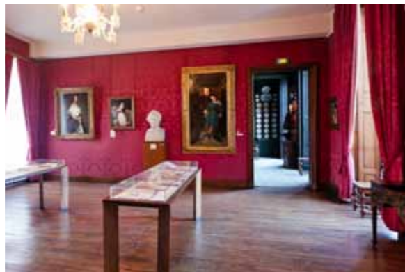
NEXT Red living room, © Sylvain Sonnet /

ADMISSION TO THE PERMANENT COLLECTION IS FREE