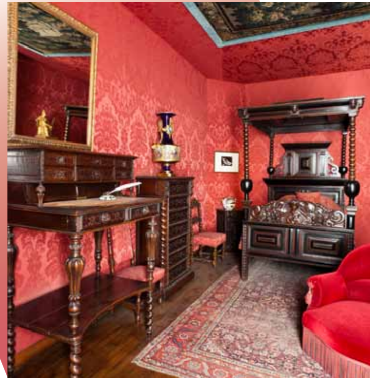
CI-CONTRE Chambre de Victor Hugo