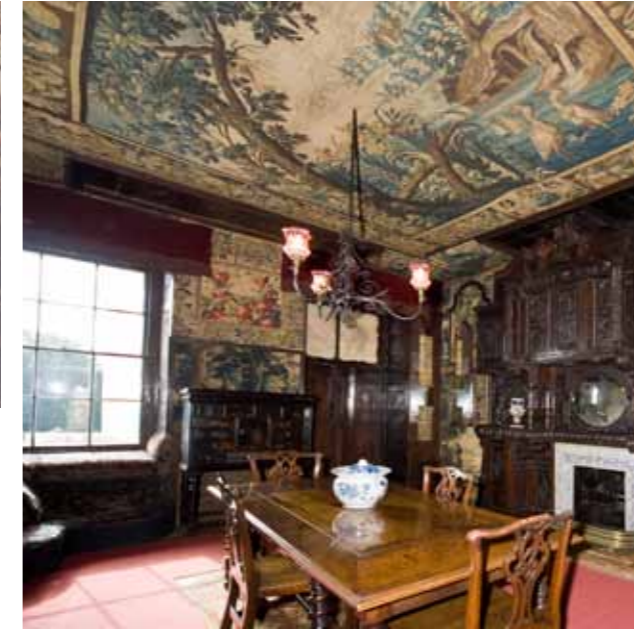
CI-CONTRE Le salon des Tapisseries à Hauteville House