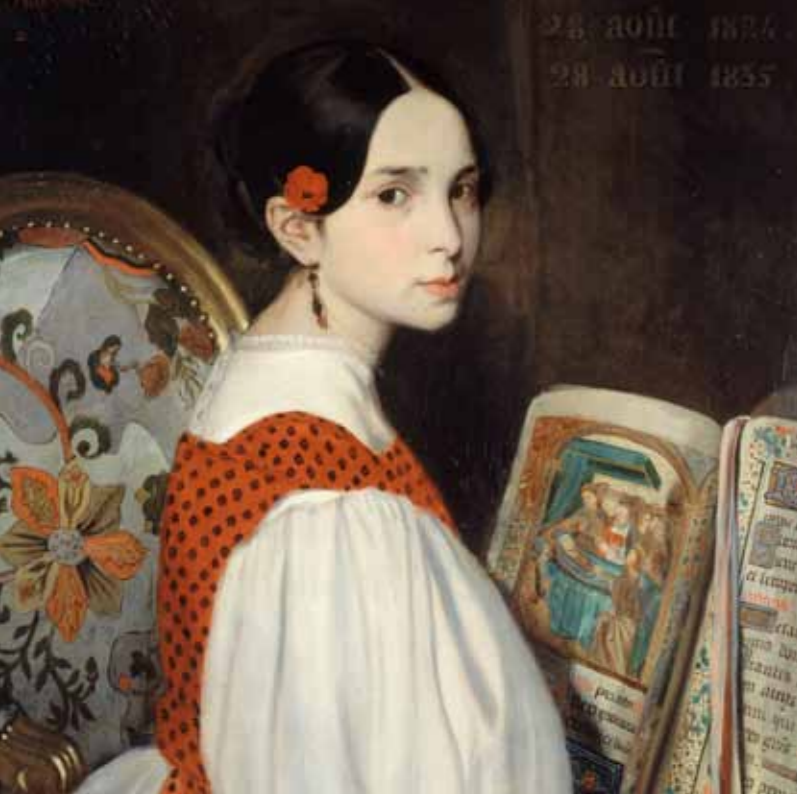
À GAUCHE Léopoldine au livre d'heures, Auguste de Chatillon, 1835