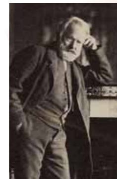
CI-DESSUS Victor Hugo dans le salon rouge à Hauteville House, Arsène Garnier, 1868

1902, année du centenaire de la naissance de Victor Hugo, marque la fondation du musée par Paul Meurice qui, avec les petits enfants du poète, fait don de riches collections, aujourd'hui présentées au sein de l'appartement, selon les trois grandes étapes de la vie de Hugo : « Avant l'exil, Pendant l'exil, Depuis l'exil ». Ces collections nous mènent de l'antichambre, et du salon rouge, qui évoquent sa jeunesse et le romantisme, au salon chinois et à la salle à manger d'inspiration médiévale qu'il conçoit à Guernesey pour Juliette Drouet, puis au salon du retour d'exil et à la chambre où il meurt en 1885, avenue d'Eylau à Paris.